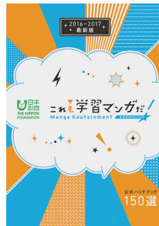
A5公式ハンドブック