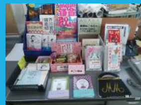
飯能高校の 「職員室へ出張図書館」。 先生方への図書館の本の 貸し出しは、昨年度の4倍に なったとのこと。 お菓子も置いていて、 先生方から差し入れもある のだとか!

ふふふ…実は、 “先生を味方につける方法”があるんです。 飯能高校図書館では2016年4月から 「職員室へ出張図書館」を始めました。 オススメ図書など置いているのですが、 新刊のマンガも混ぜておくんです。 すると先生も読んで「面白い」と。 マンガのリクエストがくることまであるんですよ。 自分がマンガを読んでいるのに、生徒が読むことを 反対できないし、何より面白さや学びになることを 知ってもらっているので、クレームが絶対に 来ないんです。 それに、先生方と私の、とても良いコミュニケーション ツールにもなっているんですよ。