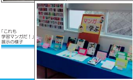
「これも学習マンガだ!」展示の様子

本校は松山市沖に浮かぶ興居島の、全校生徒27人の中学校です。同じ敷地内に小学校もあり、小中一緒に給食を食べたりと、にぎやかに過ごしています。 「これも学習マンガだ!」は、支援員同士の情報交換で知りました。チラシを全校生徒に配り、図書館内にあつた9作品とポスターを展示しました。その中で『光とともに』を展示しました。『光とともに』は、自閉症児を抱えて『』を読んだ生徒がいて、ハンディを持つことこのサポートに興味を持ち、その職業について調べ、「職場体験学習」の場所選定の参考にしています。 このことを通して、マンガは職業について知ることができ、進路について考える手助けになると感じました。校長先生も興味を持ってくださって、すぐにマンガを読んでもういただきました。