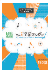
公式 ハンドブック [A5版]