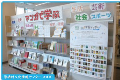
恩納村文化情報センター (沖縄県)