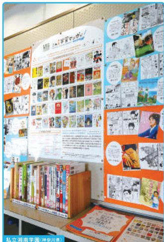
私立湘南学園 (神奈川県)