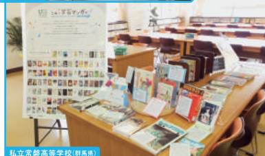
私立京華高等学校 (群馬県)