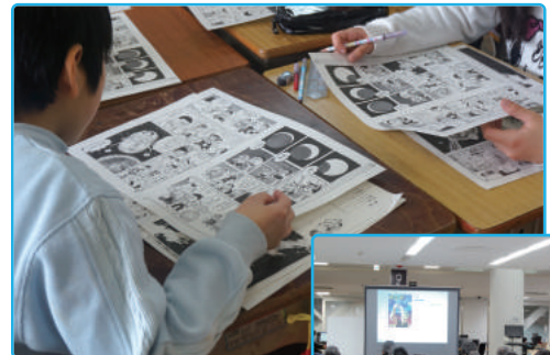
つくば市立吾妻小学校「道徳」の授業の様子