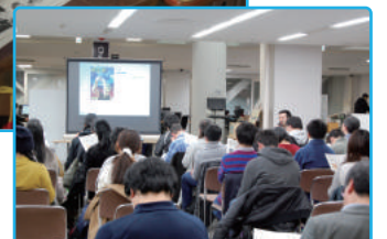
筑波大学にて「マンガ×学びの最前線」について講演も実施

2018年3月現在、全国のべ171の書店と405の図書館で活用されています。多様な活用事例も報告され、今後も息の長い展開が期待できるプロジェクトです。