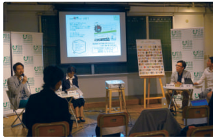
2016年度選出作品発表イベント