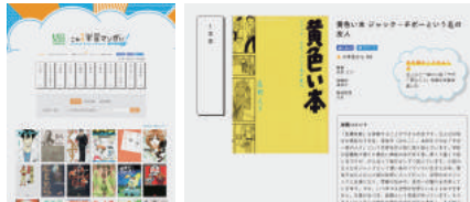
「これも学習マンガだ!」公式サイト

どこが「学び」につながるかをまとめた「推薦コメント」(POP等に自由に使用可)とともに、選出作品をWEBで公開。記者発表、イベント等も実施。